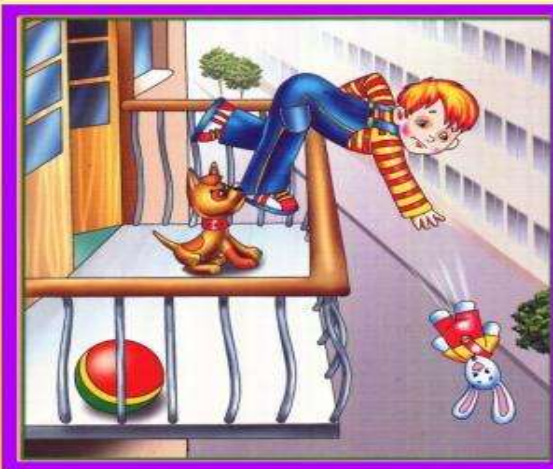
Не играй на балконе, упадешь