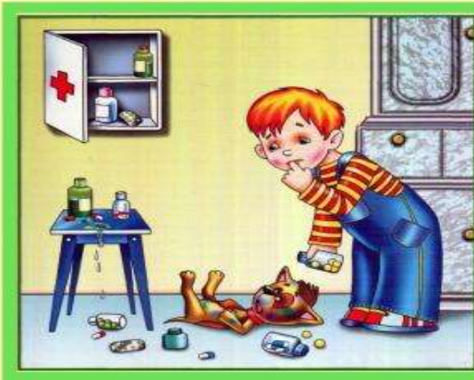
Не трогай таблетки