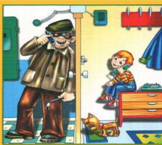
Не разговаривай и не открывай дверь незнакомым людям