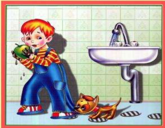
Мойте руки перед едой