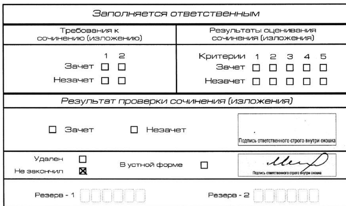
Рис. 12. Заполнение полей нижней части бланка регистрации (завершение написания сочинения (изложения) по уважительным причинам)

В случае если участник итогового сочинения (изложения) по состоянию здоровья или другим объективным причинам не может завершить написание итогового сочинения (изложения), он может покинуть место проведения итогового сочинения (изложения). Члены комиссии по проведению итогового сочинения (изложения) составляют «Акт о досрочном завершении написания итогового сочинения (изложения) по уважительным причинам» (форма ИС-08), вносят соответствующую отметку в форму ИС-05 «Ведомость проведения итогового сочинения (изложения) в учебном кабинете ОО (месте проведения)» (участник итогового сочинения (изложения) должен поставить свою подпись в указанной форме). В бланке регистрации указанного участника итогового сочинения (изложения) необходимо внести отметку «X» в поле «Не закончил» для учета при организации проверки, а также для последующего допуска указанных участников к повторной сдаче итогового сочинения (изложения) в дополнительные сроки. Внесение отметки в поле «Не закончил» подтверждается подписью члена комиссии по проведению итогового сочинения (изложения).